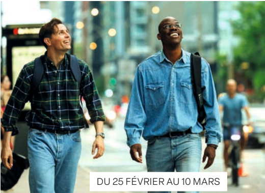
DU 25 FÉVRIER AU 10 MARS

Inspiré d’une histoire vraie, ce film raconte le parcours de deux outsiders qui, grâce à leur passion absolue pour le basket et leur amitié indéfectible, ont bravé tous les obstacles pour réaliser leur Rêve Américain.