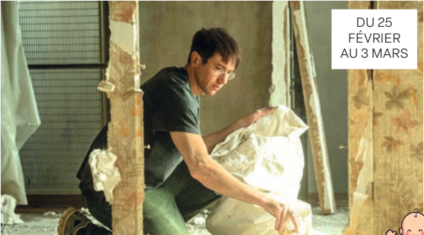
DU 25 FÉVRIER AU 3 MARS

À Pied d’œuvre raconte l’histoire vraie d’un photographe à succès qui abandonne tout pour se consacrer à l’écriture, et découvre la pauvreté.