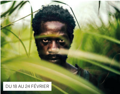
DU 18 AU 24 FÉVRIER