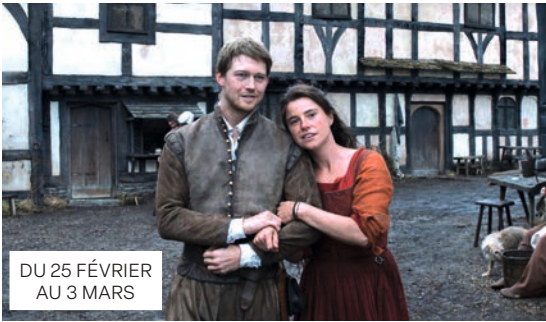
DU 25 FÉVRIER AU 3 MARS