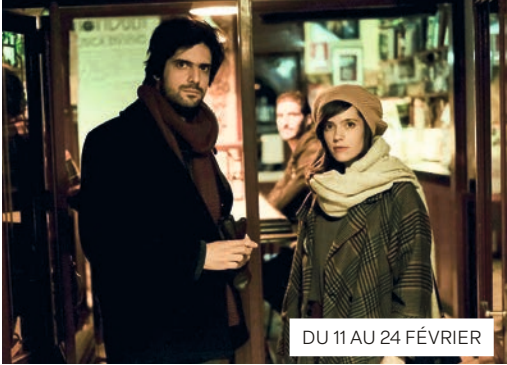
DU 11 AU 24 FÉVRIER

Pour sa deuxième entrée dans la compétition officielle de Cannes, Kelly Reichardt détourne les codes du film de braquage avec une proposition séduisante et créative, à la direction artistique astucieusement élégante. Fiction tragicomique au cœur d’une société en pleins bouleversements politiques et sociaux, The Mastermind est aussi une errance jazzy portée haut par Josh O’Connor. On comprendra bien vite que le stratège (mastermind) du titre est féroce