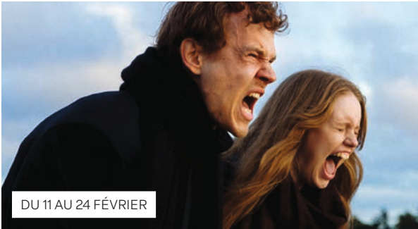
DU 11 AU 24 FÉVRIER

Préparez-vous au grand départ pour le sud de la Finlande ! Son dialecte particulier, sa lumière d’une clarté et d’une netteté merveilleuse, ses parents taiseux et religieux, et ses jeunes loin des normes: vous allez voyager. Et surtout en prendre plein les oreilles car ce film nous immerge aux côtés d’un groupe de musique expérimentale, ou plutôt, selon eux, d’un collectif d’art sonore. Fourmillant d’idées, il propose une approche extrêmement ludique du travail de la musique concrète, toutes les compositions du film ayant d’ailleurs été enregistrées sur le plateau pendant le tournage (en sortant, vous saurez enfin quel genre de musique font les écrous quand on les mixe dans un mixeur !). Profondément punk, profondément libre, une vraie découverte.