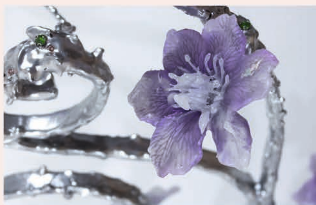
* LAMBEAUX DE FICTION